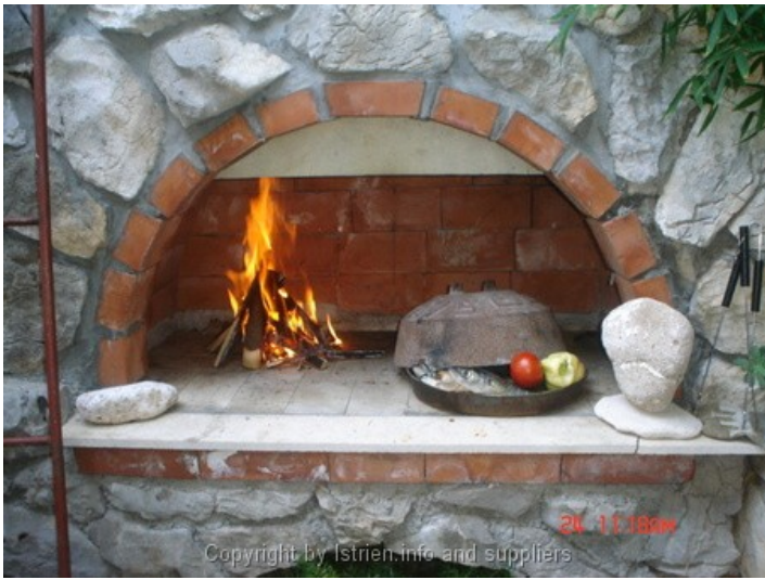
24 11:18AM