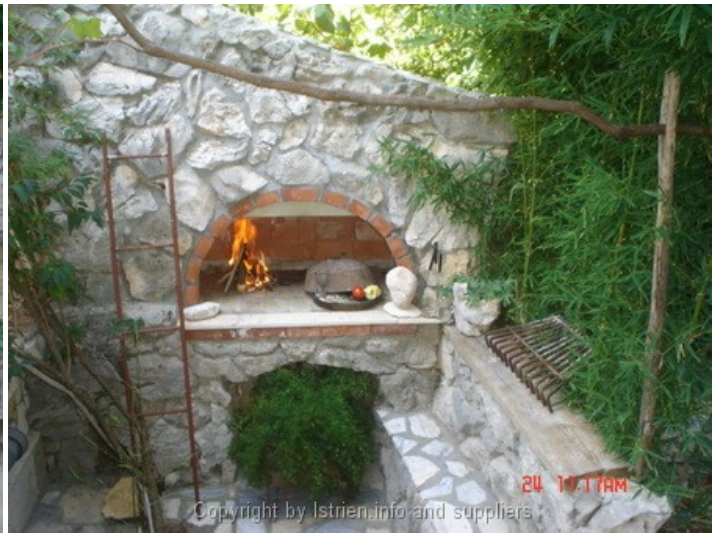
24 10:17AM