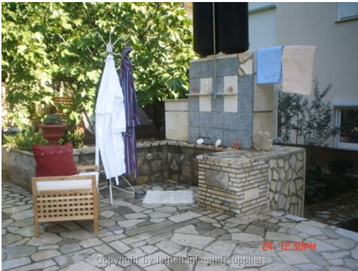
24 12:30PM