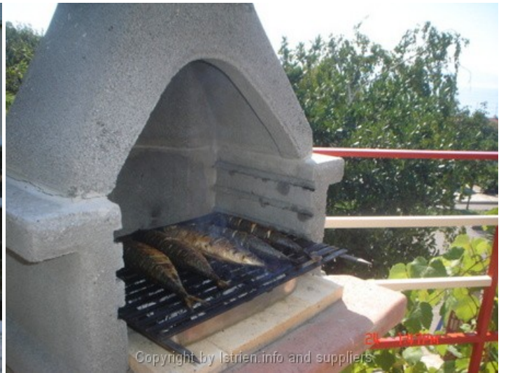
24 10:17AM