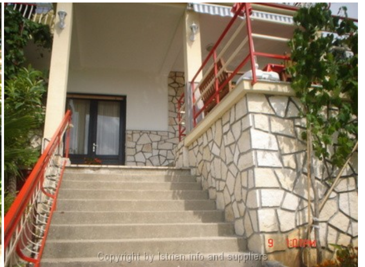
9 1:07AM